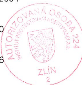
RNDr. Radomír Čevelík představitel autorizované osoby

Počet stran: 6 Místo a datum vydání: Zlín, 1. 12. 2004 Změna a) od: 1. 1. 2008 Změna b) od: 29. 12. 2010 Změna c) od: 6. 12. 2013 Platnost osvědčení do: 31. 12. 2016