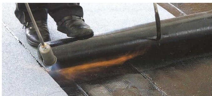
Natavování s navíječem rolí