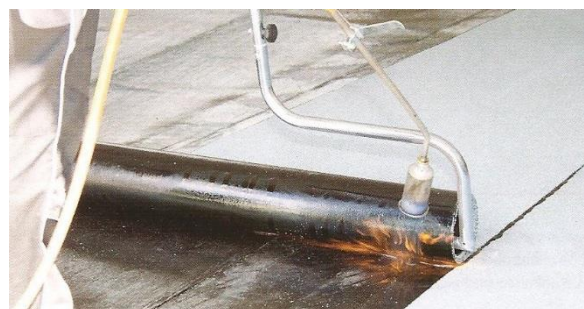
Variantní natavování rozbalovačem rolí